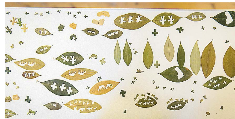
Verk av Edinson Quinones.