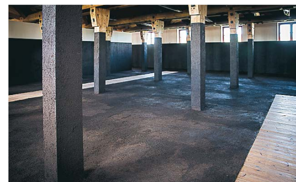
Installation av Delcy Morelos.