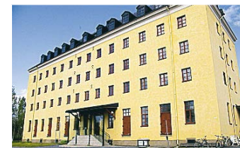
Sveriges till ytan största konsthall byggdes 1912 som fodermagasin för militärhästar i Boden.