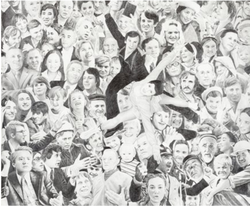
Miten kirkaana aurinko paistoikaan/Oh, How the Sun Shone Brightly 2013, lyijykynä paperille/pencil on paper, 150x190 cm. Jenny and Antti Wihuri Foundation Collection, Rovaniemi Art Museum

I korthet uppvisar hans teckningar den dialektiska ( diskuterbara ) dynamik som under den socialistiska utopin endast existerade på fotografier och i texter som mångfaldigades i propagandatidskrifter, men som trots det var en verklig utopi, som trycktes, distribuerades och delades.