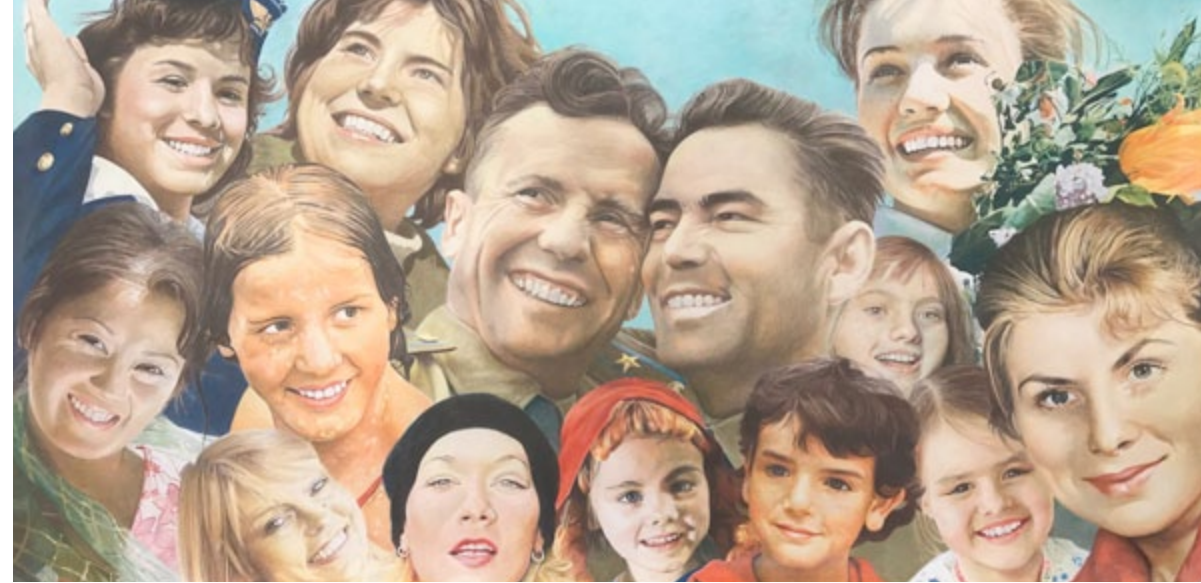
Me näemme vielä kommunisminkin! We Are Yet to See Communism as Well!, 2016–2017, colored pencil on paper, 150x290 cm

Det finns en optimistisk tro på det högre syftet – eller i alla fall ett sken av det – i uttrycket hos de människor som Lampela tecknade. Deras blick är fäst vid horisonten, där något som möjligen kan bli verklighet väntar. De blickar mot det högsta politiska idealet: den fria världen som politikens högsta mål och en maktöverföring. Vi kan inte veta vilken sorts paradiset det är och inte heller Lampelas teckningar säger det rakt ut. Hans målningar hänvisar till en utopisk, abstrakt, men då och då även gripbar rörelse och ett politiskt tryck, kraften i hopp och drömmar.