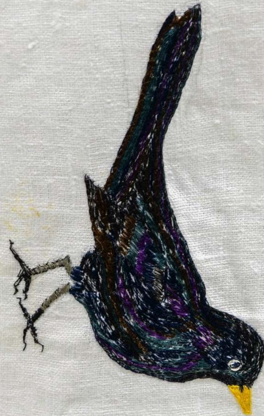
EN SOL, ETT REGN, EN BÅGE. EN HYLLNING TILL ALLA SOM HAR STÅTT UT ATT LEVA FÖRE OSS, 2021 JOAKIM FORSGREN

Gravtäcke med broderade symboler: en sol, ett regn och en regnbåge skapar känsla av en ljus sorg och bjuder till stillsam reflektion över de döda som finns med oss i våra tankar. Runt kanten på textilen finns bilder av olika symboler och bokstäver med årtal, såsom ax, råg, havre och vete, tillsammans med bilder av en koltrast och en gråsparv, samt landskapsblommor. Varje bokstav representerar initialen på en släkting till kvinnan som utförde broderiet. I ett hörn av textilen står orden "Samtal pågår...", vilket symboliserar kontinuitet och samhörighet över generationer.